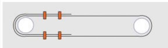
Cách thắt dây tốt nhất và được khuyến nghị